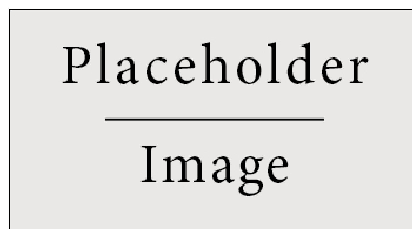
Figure 1:Figure caption

Lorem ipsum dolor sit amet , consectetur adipiscing elit. Sed commodo molestie porta. Sed ultrices scelerisque sapien ac commodo. Donec ut volutpat elit. Sed laoreet accumsan mattis. Integer sapien tellus, auctor ac blandit eget, sollicitudin vitae lorem. Praesent dictum tempor pulvinar. Suspendisse potenti. Sed tincidunt varius ipsum, et porta nulla suscipit et. Etiam congue bibendum felis, ac dictum augue cursus a. Donec magna eros, iaculis sit amet placerat quis, laoreet id est. In ut orci purus, interdum ornare nibh. Pellentesque pulvinar, nibh ac malesuada accumsan, urna nunc convallis tortor, ac vehicula nulla tellus eget nulla. Nullam lectus tortor, consequat tempor hendrerit quis, vestibulum in diam. Maecenas sed diam augue. This statement requires citation [1].